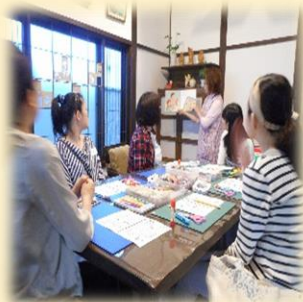
絵本の読みきかせ